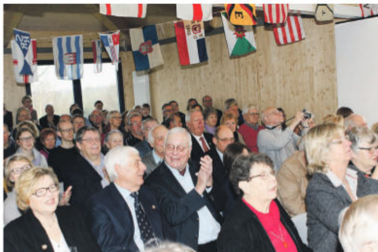
Beste Stimmung herrschte unter den Mitgliedern während der Einweihungsfeier.