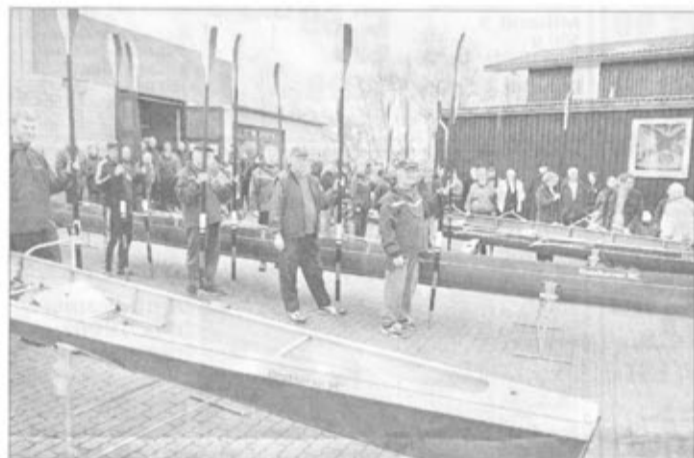
Traditionell werden die Ruderboote am Anfang der neuen Saison zu Wasser gelassen.