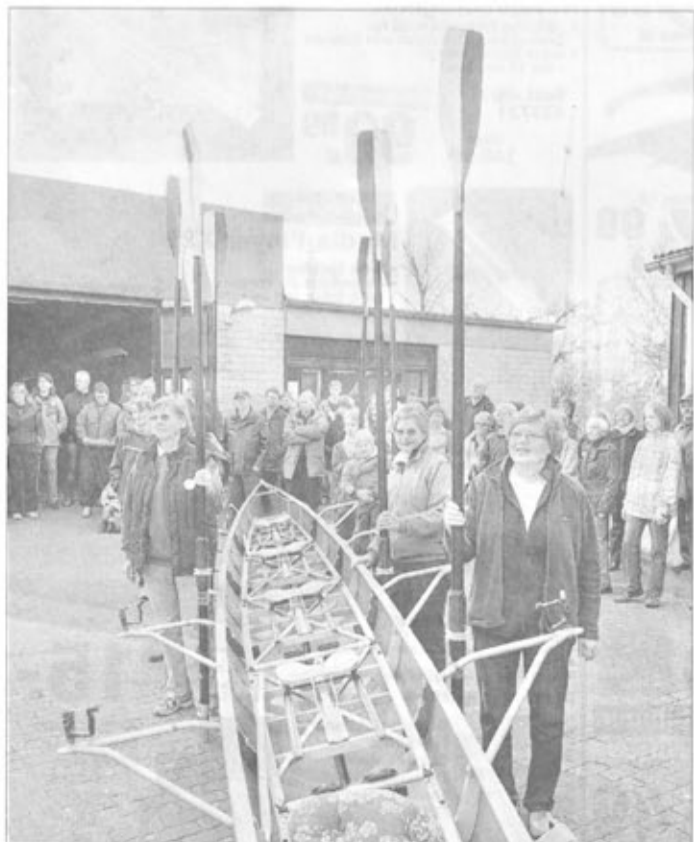
Immer wieder ein besonderer Augenblick ist es, wenn die Boote zu ersten Mal zu Wasser gelassen werden.

Zum schleswig-holsteinischen Rudertag in Elmshorn im Jahr des 100. Geburtstages des Elmshorner Ruderclubs kamen 250 Gäste.